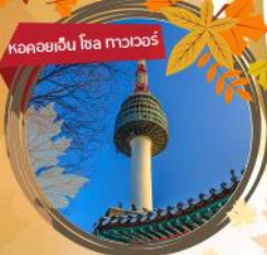
หอคอยเอ็นโซ ทาวเวอร์