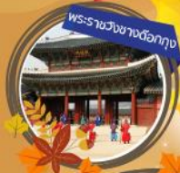
พระราชวังชางว็องกุก