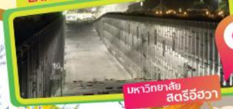
มหาวิทยาลัยสตรีอีวา